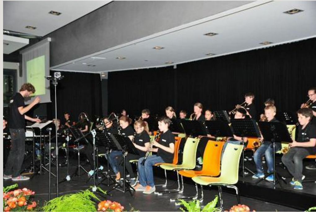
Klasse 5B Galilei-Gymnasium in Hamm